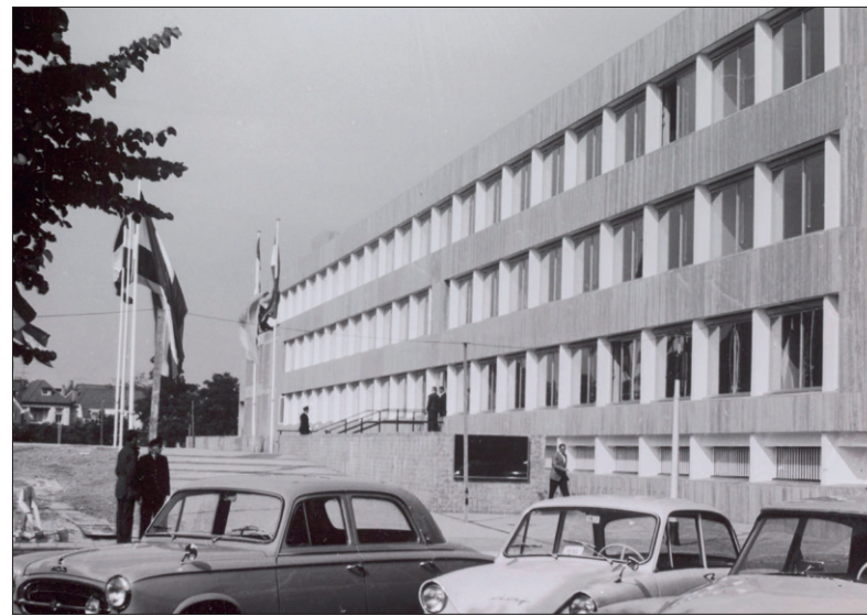
■ Het raadhuis uit 1961.