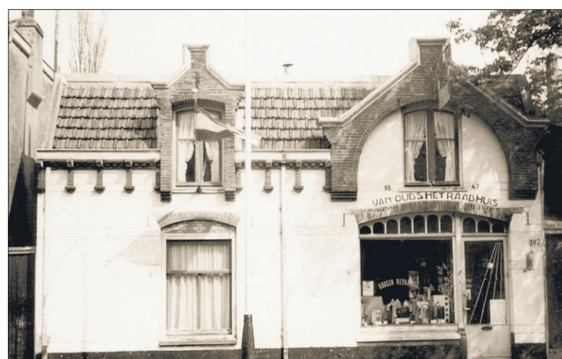
■ Het kousenwinkeltje met in de gevel 'Vanouds het raadhuis' in de gevel. Foto genomen omstreeks 1960.

FOTO EN TEKST: STREEKARCHIEF GOOISE MEREN