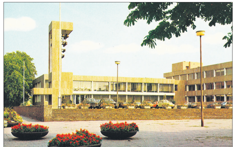
■ Het gemeentehuis in 1992.