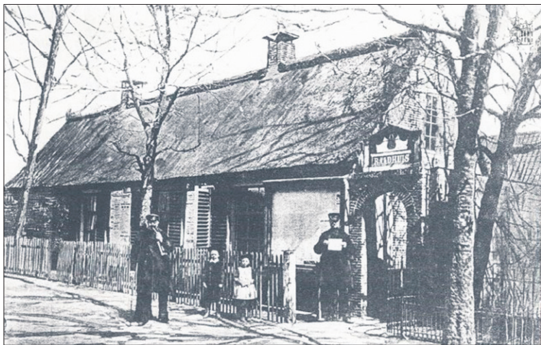
■ Het oude raadhuis uit 1845.

Toen het nieuwe gemeentehuis in 1961 in gebruik was genomen, werd het oude raadhuis aan de Brinklaan direct gesloopt, om