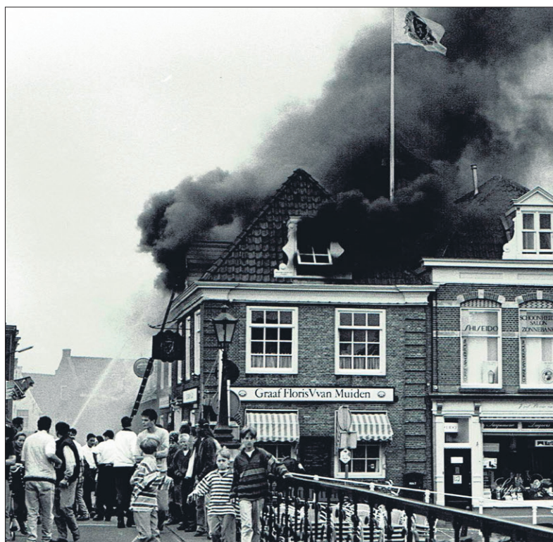
■ De brand op 12 juni 1994.

FOTO EN TEKST: STREEKARCHIEF GOOISE MEREN