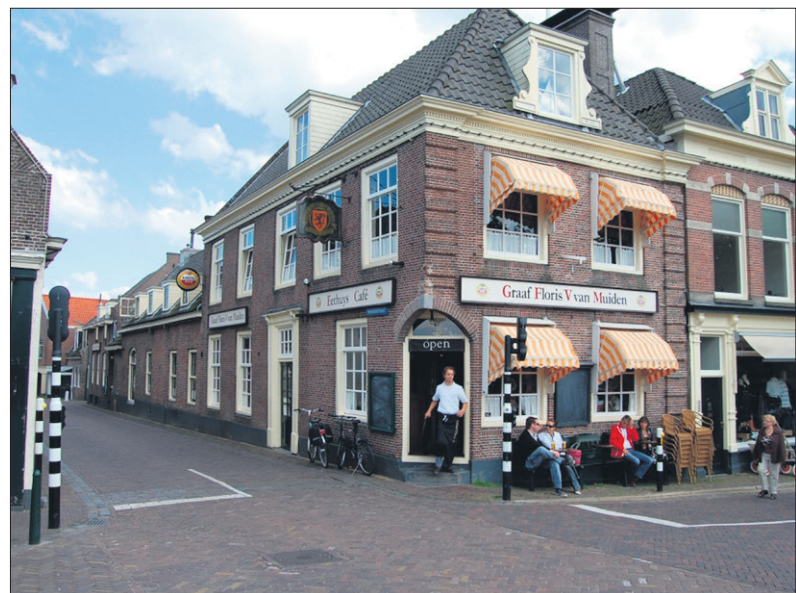
■ Restaurant Floris V van Muiden in 2020.

de Greef. Deze trof het niet: in de jaren 30 kwam de economische crisis en in 1940 de oorlog. Hij verzoon een list: hij kocht van de Chemische Fabriek Naarden 100% alcohol en versneed deze tot een drankje dat 30% alcohol bevatte en verkocht dat onder de toonbank. In 1958 verkocht hij het Hof van Holland. In 1977 werd het opnieuw verkocht, nu aan een combinatie van eigenaren. Deze heren zagen niets in een café of een herberg, maar besloten er een eethuis van te maken. Zij restaureerden het eeuwenoude pand met oude