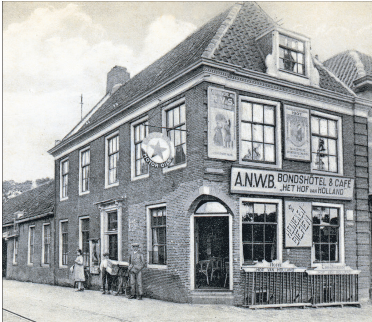
■ Het Hof van Holland in de jaren 20.