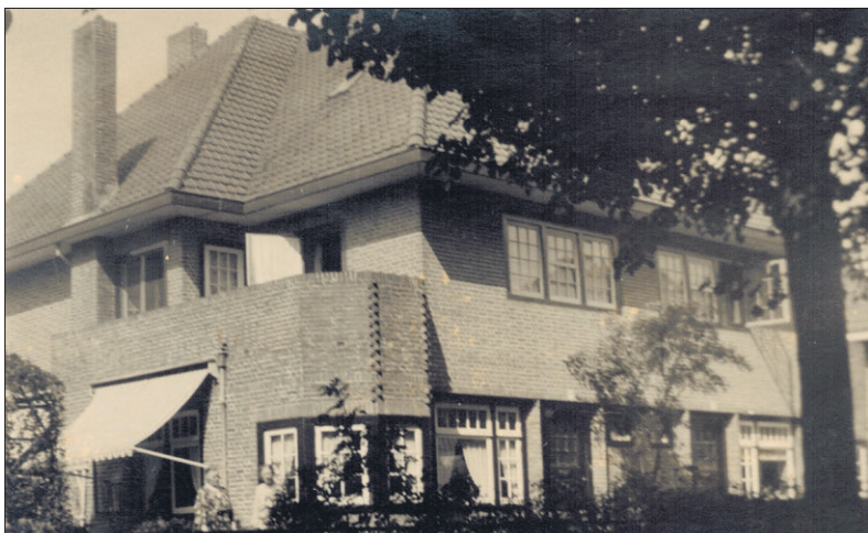
■ Gooiberg 36, waar het echtpaar in zijn laatste levensfase woonde.