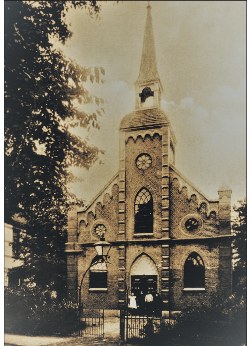
■ Het kerkje aan de Iepenlaan omstreeks 1900.