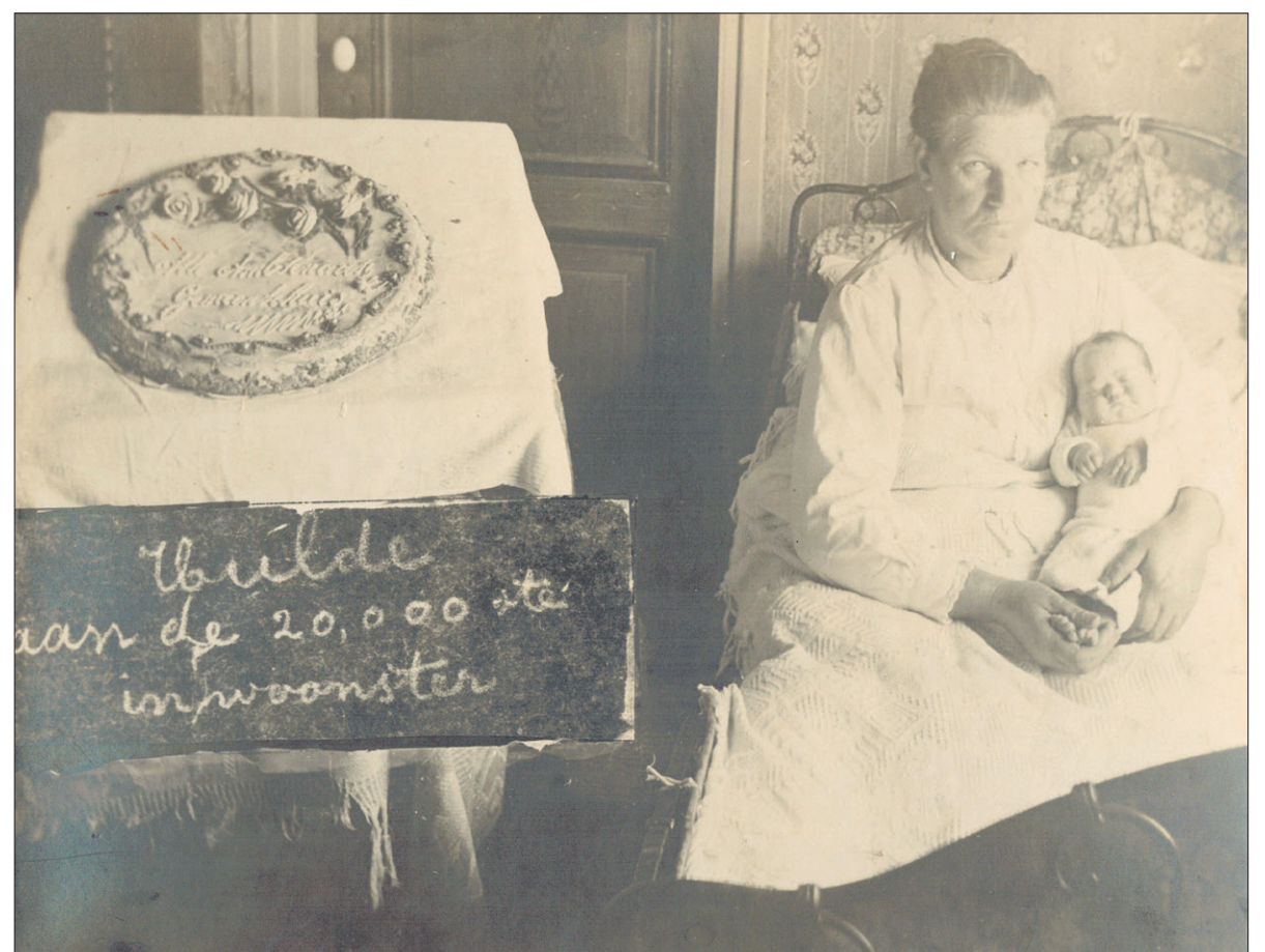
■ Moeder en dochter met de taart van de ambtenaren.