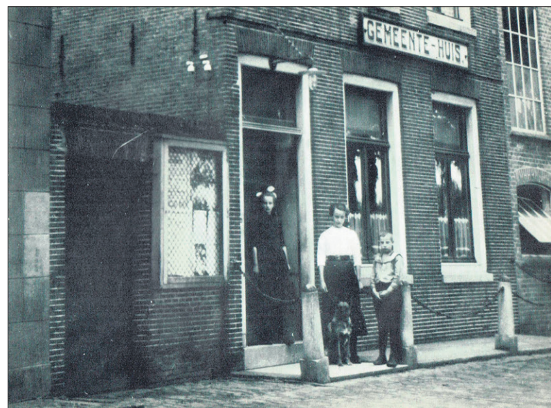
■ Het stadhuis naast de zoutfabriek uit 1884.