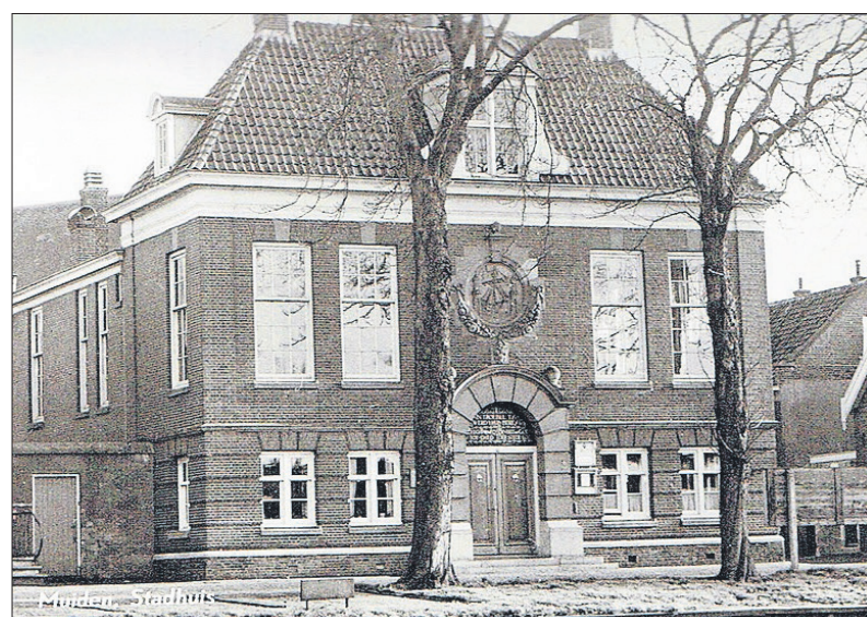
■ Het stadhuis van 1915.