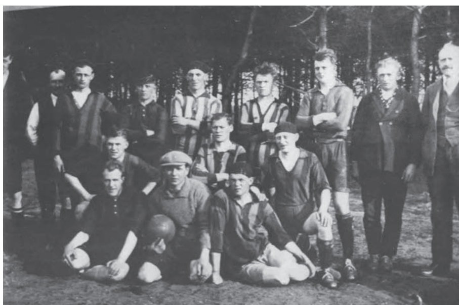
Het team van De Kaap

De aardappelkelders die dienst deden als kleedkamers