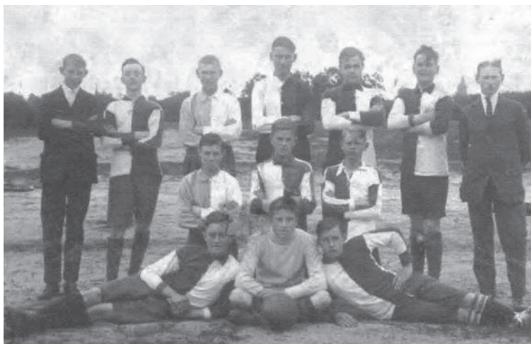
SDO in het oprichtingsjaar 1917

kreeg AW concurrentie van SDO. Nou ja, concurrentie... SDO was een katholieke club en destijds liepen er niet alleen in de kerk, maar ook in het sportieve en culturele leven nog vrijwel ondoordringbare grenzen tussen de verschillende bevolkingsgroepen in Bussum. Van SDO kon je alleen lid worden als je katholiek was. De officiële naam luidde: de Rooms-Katholieke Voetbalvereniging Samsenspel Doet Overwinnen (R.K.V.V. S.D.O.). Burgemeester Han ter Heegde memoreerde in zijn voorwoord in het jubileumboek SDO 100 jaar de veldslagen die in 1917 in Europa werden gevoerd, de Russische Revolutie, de oprichting van de Nederlandse Spoorwe-