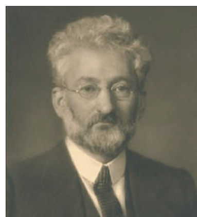
■ K.P.C. de Bazel.

Na de eeuwwisseling begon De Bazel in Bussum een eigen architectenbureau. Hij ontwierp niet alleen villa's, maar ook arbeiderswoningen in de Spaarndammerbuurt in Amsterdam en vooral in de Godelindebuurt in Bussum. Daarnaast ontwierp hij meubels en gebruiksvoorwerpen, onder andere voor het koningshuis: in 1901 een Pulchrikast ter gelegenheid van het huwelijk van Koningin