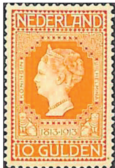
■ Postzegel uit 1913 ontworpen door De Bazel.

Toen Karel in 1895 met een ontwerp voor een algemeen bibliotheekgebouw deelnam aan de ereprijsvraag van het genootschap Architectura et Amicitia, bleek Cuypers samen met de architecten Peters en Berlage in de jury te zitten. De jury vond geen enkele van de ingezonden ontwerpen goed genoeg, ook dat van De Bazel niet. De jury noemde het ontwerp wel knap, maar keurde het toch af vanwege een niet juist geachte plattegrond. Bovendien sprak de jury van een bedenkelijke monumentaliteit, onder andere vanwege de 'hier en daar ingesneden vreemdsoortig aan houtsnijkunst herinnerend ornamenten' en vanwege de grote muurvlakken met kleine vensters