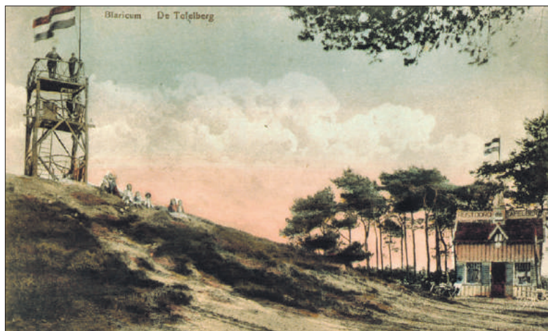
De Tafelberg in het begin van de twintigste eeuw.

- Sarah Remmerts de Vries, 'Uitkijkpunt Tafelberg opgeknapt', website Oneindig Noord-Holland 26-02-2020 - F. Ruijter, 'Groeten uit mooi Blaricum' (2007)