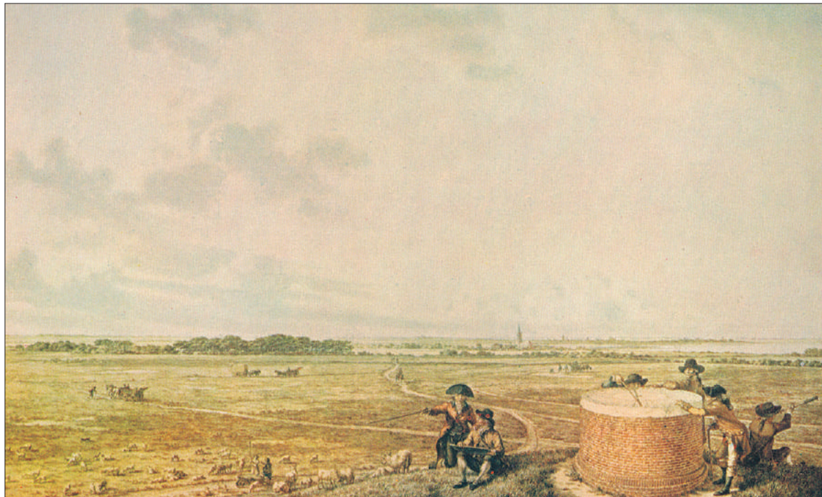
De Tafelberg op een aquarel van Jacob Cats (ongeveer 1780).

Het waterreservoir op de Tafelberg werd gemaakt van gewapend beton en had een nuttige inhoud van 600 m 3 . Het kreeg de vorm van een twaalfhoekig prisma. De grond om het reservoir heen werd zodanig aangebracht dat via een trap een toegankelijk uitkijkplatform werd verkregen. Er werd een zo natuurlijk mogelijke beplanting gekozen. Hierdoor besefte menig bezoeker niet dat er 600 m 3 drinkwater onder zijn voeten lag. Vanaf een hoogte van 28 meter konden bezoekers van het weidse uitzicht genieten. Door deze ingreep is de Tafelberg enige meters verhoogd.