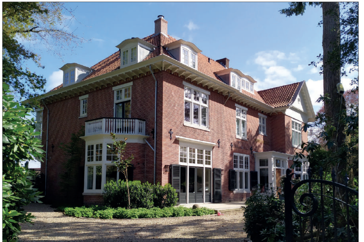
■ Villa Berkenheuvel.

In 1955 openden de paters Kruisheren in Villa Vijverberg aan Willemslaan 1 (hoek 's-Gravelandseweg) opnieuw een katholiek lyceum, dat uit zou groeien tot het (Sint-)Vituscollege. Een nieuw schoolgebouw kon het Vitus pas betrekken in 1966. Voordien werd het gestaag groeiende leerlingenaantal ondergebracht in steeds meer noodlokalen op het glooiende terrein van Vijverberg. Ook het Broederhuis van de Vituskerk (St. Vitusstraat 4) bood