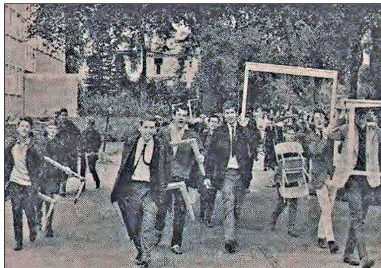
■ 1966: meubilair wordt door de leerlingen verhuisd.

het leerlingental tot meer dan 1200 uitgroeien. In 1984 werd villa Berkenheuvel verkocht. Pas in de jaren tachtig kon een deel van de noodlokalen op het voorplein worden verwijderd, toen er op een minder opvallende plek achter de school noodlokalen waren bijgebouwd. In 2005, na de voltooiing van het 'Bètagebouw' langs het sportveld, konden ook die noodlokalen verdwijnen. De resterende noodlokalen, die nog steeds voor de school stonden, zijn in 2019 vervangen door het 'Artgebouw', dat voor het oude gebouw werd neergezet. In het nieuwe logo van de school zijn de vier gebouwen: het hoofdgebouw, de gymzalen, het Bètagebouw en het Artgebouw schematisch weergegeven.