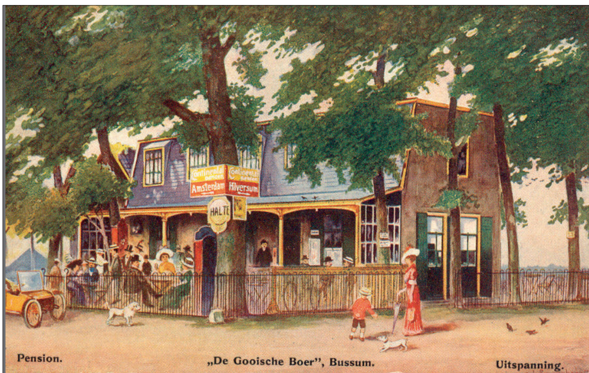
De Gooische Boer op een reclamekaart uit 1914; de richtingwijzers wijzen de verkeerde kant op.

Er werd echter in diezelfde tijd nog een wijk bijna letterlijk uit de grond gestampt, in het gebied tussen de Huizerweg en de wel geplande, maar nog niet gerealiseerde Ceintuurbaan. Het was echter een heel andere wijk dan de eerder genoemde, want het hart ervan werd gevormd door een paar honderd arbeiderswoningen. Dat was andere koek dan de villawijken die tot dan toe rond het oude boerendorp waren ontstaan. Hoe dat allemaal in zijn werk is gegaan