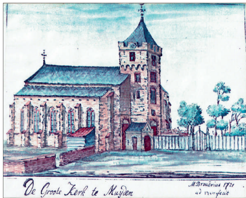
De Grote Kerk.

In 1425 werd het romaanse kerkje vervangen door de huidige