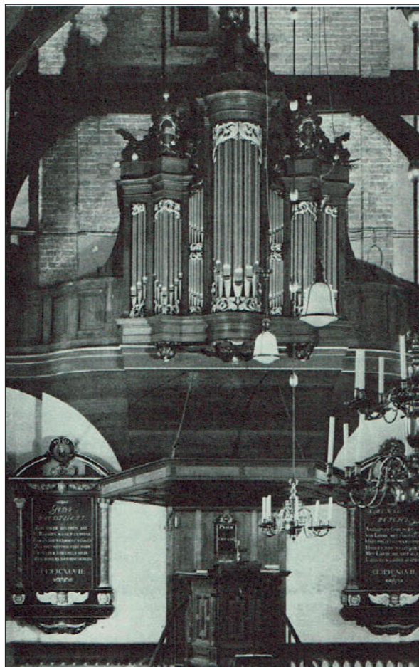
Het orgel, de preekstoel en de P.C. Hooftborden uit 1647.