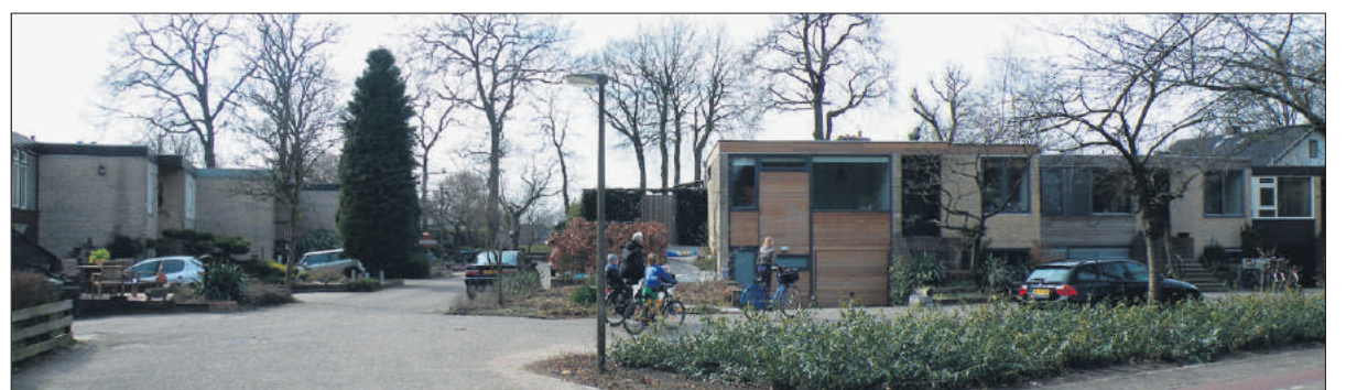
De geschakelde drive-inwoningen.