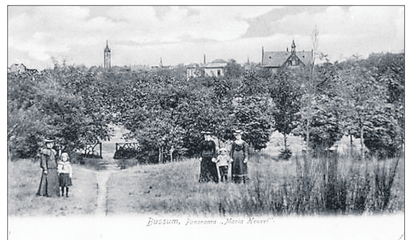
Het uitzicht op Bussum vanaf de heuvel.