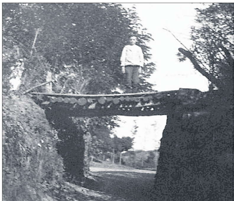
Het bruggetje in het wandelpark.