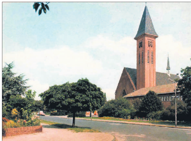
■ De Heilig Hartkerk in 1980.

In 1988 werd de kerk verkocht aan een projectontwikkelaar, die van plan was 37 appartementen in de