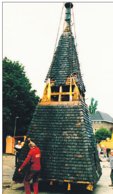
■ De torenspits is eraf getakeld.