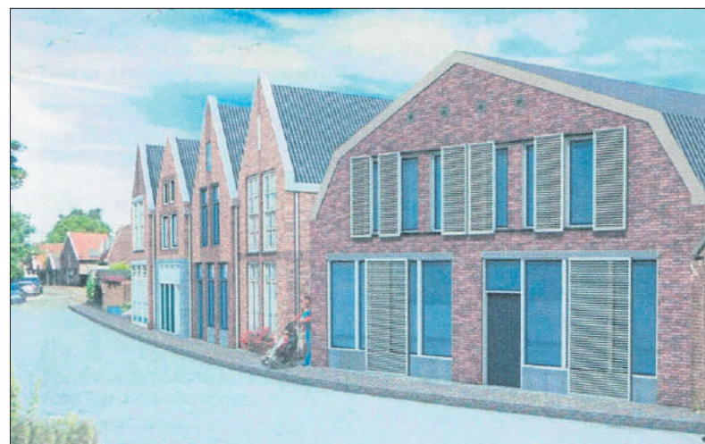
■ Een impressie van de te bouwen huizen uit 2021.

Villa Amuda maart 2009 en juni 2019. Muidernieuws Extra en Muidernieuws van 28.4.2021. Gemeenteblad GM 2022 ,48299.