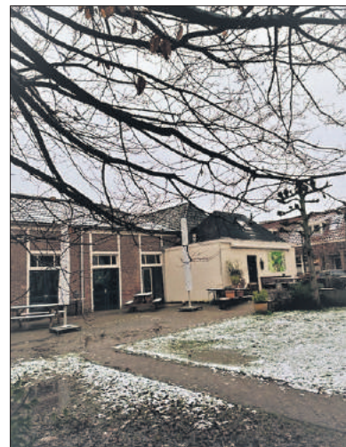
■ De zaal en het café in 2023.

In het café stond een biljarttafel waar veel gebruik van werd gemaakt. In de zaal, die via schuifdeuren met het café was verbonden, was een toneelopbouw met een zij-ingang. Die zaal bood plaats aan toneelvoorstellingen, verenigingsbijeenkomsten, bruiloften en andere festiviteiten. In de pauze van een voorstelling gingen de schuifdeuren open en kon je aan de bar een drankje halen. Frits en Do brachten de bestellingen desgevraagd ook aan tafel. Na een voorstelling gingen de stoelen