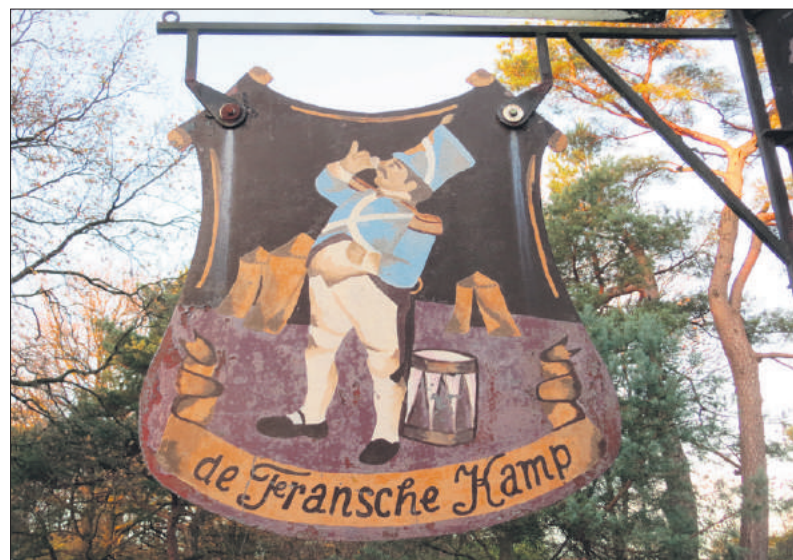
■ Het uithangbord bij de receptie van het kampeerterrein.