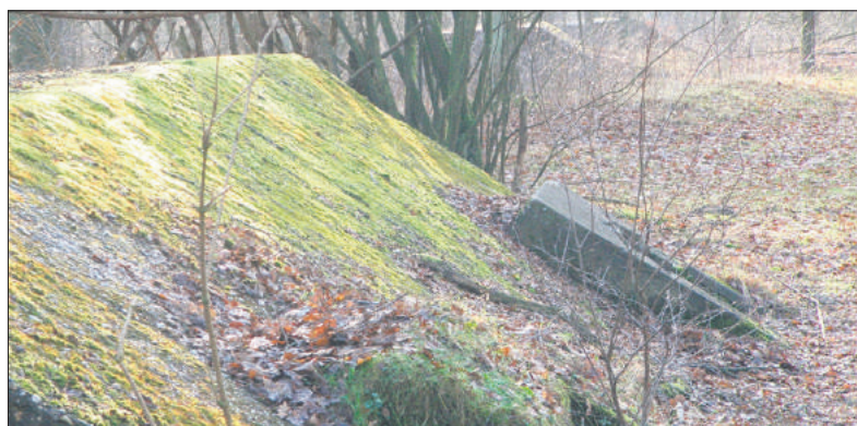
■ Betonnen groepsschuilplaatsen in De Fransche Kamp.

schansen met daartussen prikkeldraadversperringen, loopgraven met wallen en droge grachten, houten schuilplaatsen en opstelplaatsen voor zware mitrailleurs. Van deze linie zijn aan de rand van de Bussumerheide nog restanten te vinden. Eind 1916 waren er weer nieuwe inzichten bij de legerleiding. Er moest opnieuw een linie komen die nóg verder van de vesting Naarden af lag: een dubbele loopgravenlinie van 's-Graveland tot onder Huizen. In 1918 werd hiermee een begin gemaakt door groepsschuilplaatsen