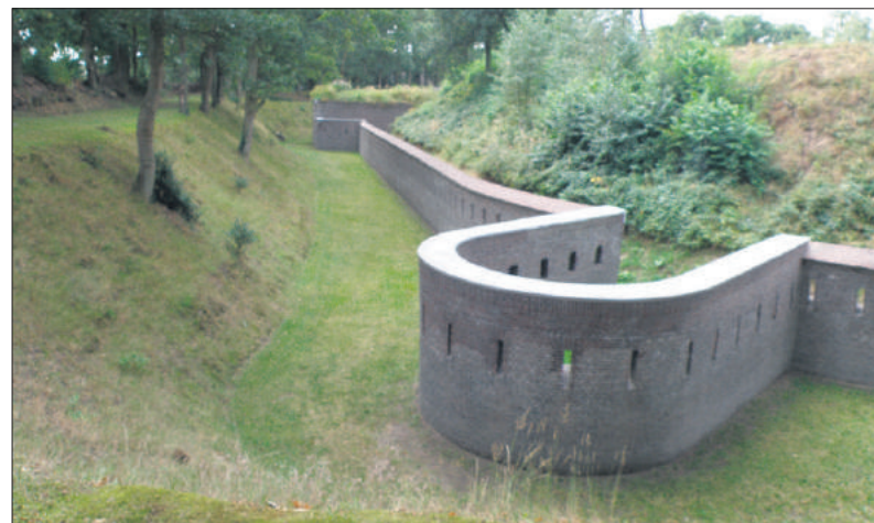
■ De muur van Werk IV in de droge gracht.