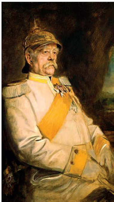
■ Otto von Bismarck, geschilderd door Franz von Lembach in 1890.

Het leger moest bij een vijandelijke aanval buiten de waterlinie een verdedigingslinie vormen. Naarden liet in 1868 vooruitgeschoven forten aanleggen waarachter het leger zich, als het werd teruggedrongen, kon hergroeperen om de vijand opnieuw te lijf te gaan. Naast de al bestaande forten en het Ericafort en het Hamerslot bij de Karnemelksloot kwamen