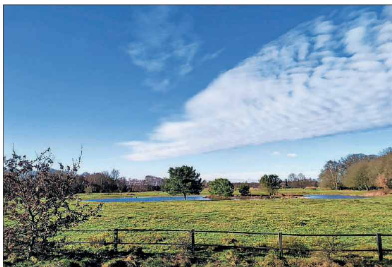
■ Het gereconstrueerde Pannenkoekenfort in het Laegieskamp.