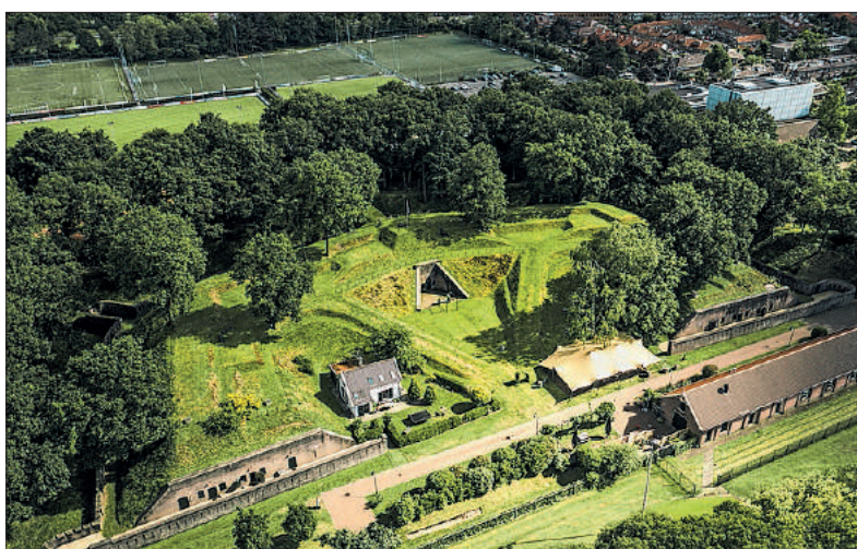
■ Luchtfoto Fort Werk IV met erachter Spant!