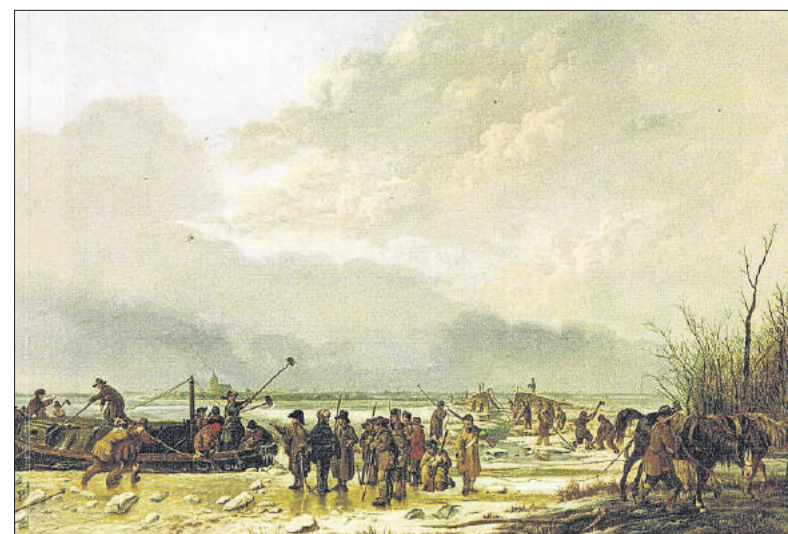
■ Het doorrijzen van de Karnemelksloot in januari 1814 met Naarden op de achtergrond. Schilderij van P.J. van Os.