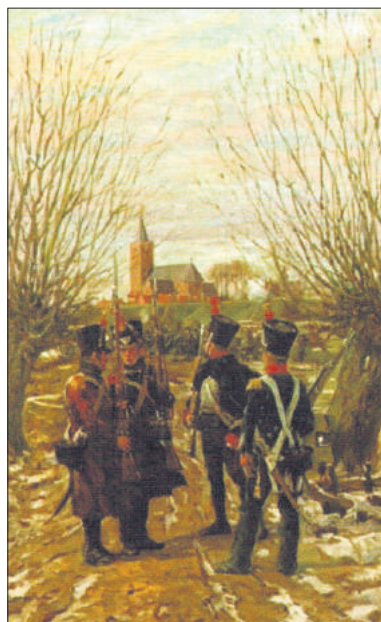
■ Amsterdamse schutterij bij Naarden met nog Franse uniformen. Schilderij van J. Hoyck van Papendrecht.

TEKST: GEMEENTEAR-