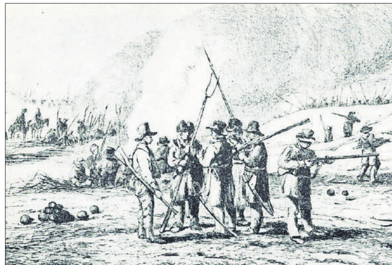
■ Leden van de Landstorm bij Naarden in 1814. Ets van P.J. van Os.

Op 6 april 1814 werd de verslagen Napoleon in Frankrijk afgezet en naar Elba verbannen. Kraijenhoff kreeg het bevel het beleg te stoppen en te beginnen met onderhandelingen met de Franse commandant Quétard. Op 12 mei 1814 verliet het garnizoen de vesting met slaande trom, het defileerde zelfs nog op de Bussumerheide voor de belegeraars, en marcheer-