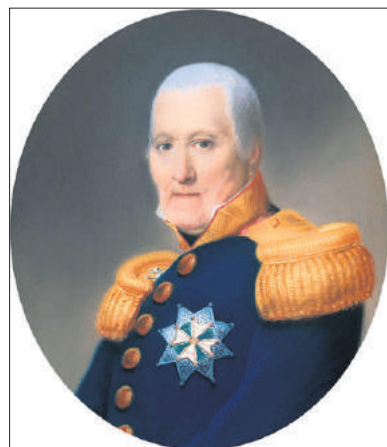
■ Luitenant-generaal C.R.Th. Baron Kraijenhoff.

Dit beleg bracht veel ellende in het kleine dorp Bussum, dat tot Naar-