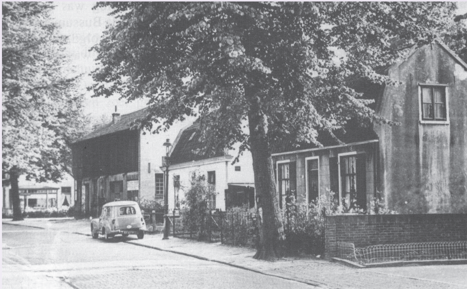
De Nieuwe Spiegelstraat met achter de auto de werkplaats van Kerkenaar v/h Joh. van Norren