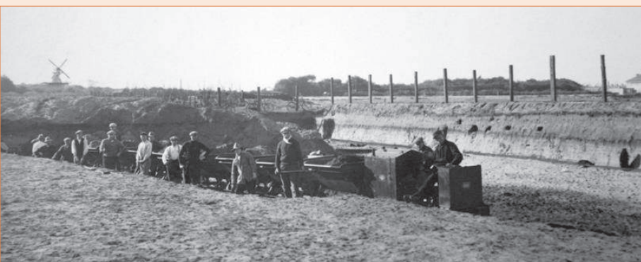
Afgraving op de Eng, met links de molen De Wandelbaar, op de Westereng