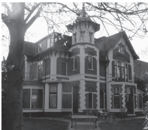
De villa van de familie Dammers aan de Koningin Emmalaan