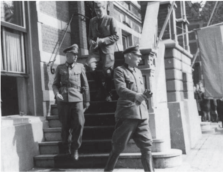
Graaf von Oberndorff op de trap van het raadhuis