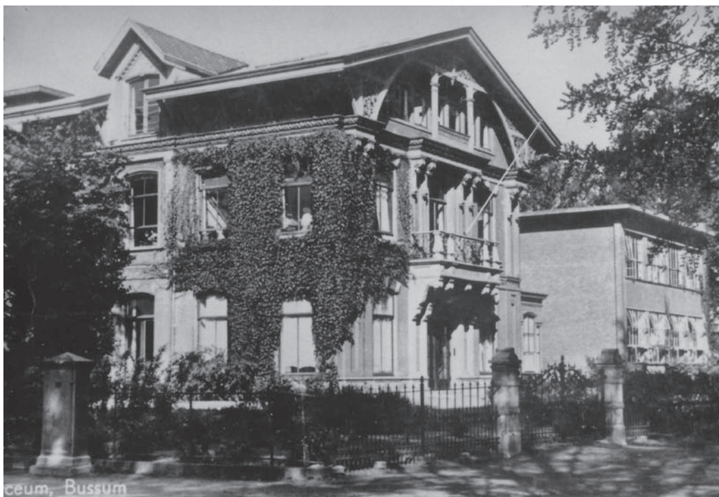
Christelijk Lyceum aan de Nieuwe 's-Gravelandseweg in 1937