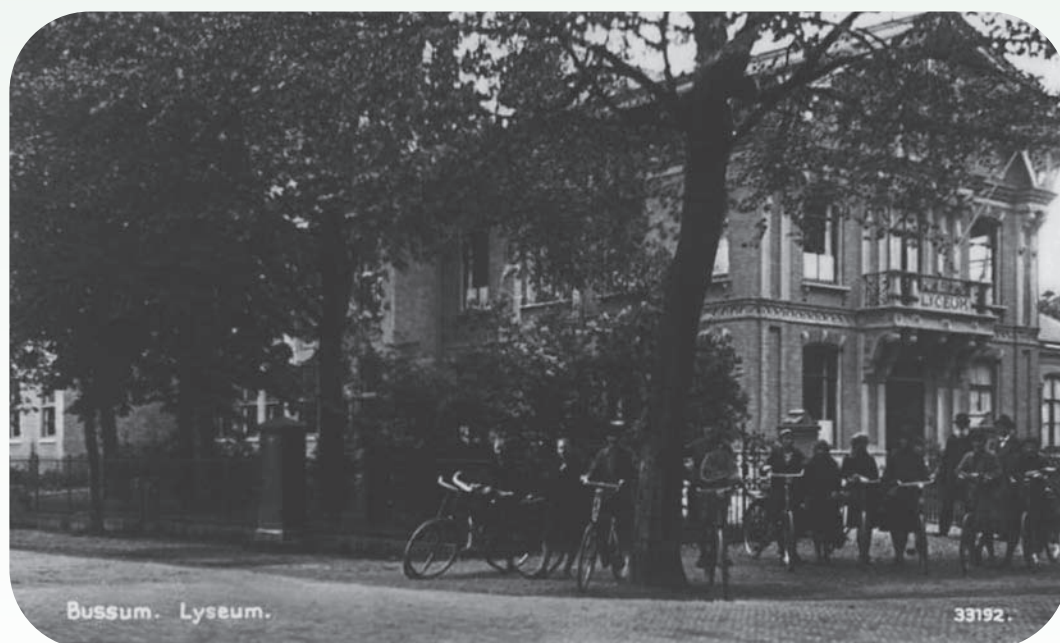
Het Christelijk Lyceum in de jaren dertig

Toen de Duitsers op 10 mei 1940 ons land binnenvielen, werd het onderwijs overal stilgelegd, wat na de capitulatie weer op gang kwam. De leraren werd verzocht de oorlogs-