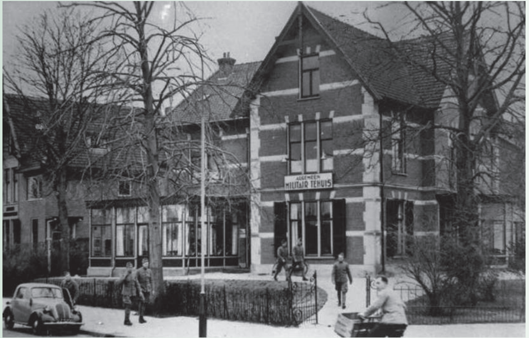
Het Militair Tehuis aan Brinklaan 30