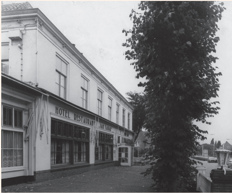
Jan Tabak ten tijde van het misdrijf

met de Amsterdamse onderwereld. De Bussumse recherche ging daar in eerste instantie niet van uit, maar men sloot de mogelijkheid ook niet geheel uit. Vast stond in elk geval dat beide slachtoffers in de aanloop