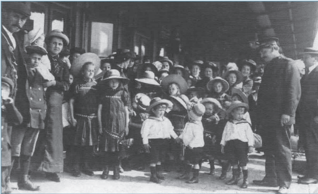
De weeskinderen van het Leger des Heils op station Naarden-Bussum (illustratie overgenomen uit De Omroeper)

en tuinarchitect Dirk Tersteeg, die in een houten huis woonde op de hoek van de Lambertus Hortensiuslaan en de Galgesteeg (nu de Godelindeweg). Er ontstond grote paniek. De bewoners van de huizen aan de Sandtmannlaan sloegen op de vlucht, want anders kun je het niet noemen. De kranten meldden dat verhuisswagens en karren de doorgang versperden en dat de voortuintjes volstonden met huisraad. De kinderen van het tehuis van het Leger des Heils aan de Lambertus Hortensiuslaan werden per trein afgevoerd naar Amsterdam. Een deel van de bomen van de kwekerijen binnen de kleine kring werd omgezaagd en dat gold ook voor de hoge iepen langs de Amersfoortsestraatweg en voor het tolhuisje op de hoek van de Amersfoortsestraatweg en de Huizerweg (bij het ophaalbruggetje dat er nog steeds ligt). Uiteindelijk werden er 6 houten woningen en wat schuren daadwerkelijk gesloopt. Er stonden nog veel meer huizen op de nominatie om te worden gesloopt, evenals een aantal schoorstenen (voornamelijk van blekerijen) en zelfs de kerktorens van Bussum en de watertoren zouden er aan moeten geloven.