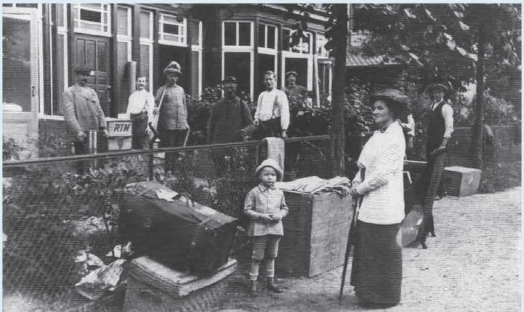
Klaar voor vertrek in de Sandtmannlaan (illustratie overgenomen uit De Omroeper)

Op 31 juli 1914 had koningin Wilhelmina een algehele mobilisatie afgekondigd. De Vesting Naarden moest in staat van verdediging worden gebracht en er werden voorbereidingen getroffen om de kleine kring, tot 300 m buiten de vesting, te ontruimen. Op woensdag 5 augustus werd een proclamatie bekendgemaakt, waarmee burgers werden geïnformeerd dat de houten huizen in het voorterrein zouden worden gesloopt. Stenen huizen mochten nog blijven staan, maar de bewoners daarvan werd wel duidelijk gemaakt dat hun huizen wellicht op korte termijn zouden volgen. Het burgerlijk bestuur werd geheel overruled door de militairen, die (te) voortvarend tewerk gingen. De bewoners van circa 285 houten en stenen huizen, ook uit de middelbare en de grote (buitenste) kringen, kregen bevel om hun huizen te verlaten. Onder hen boomkweker