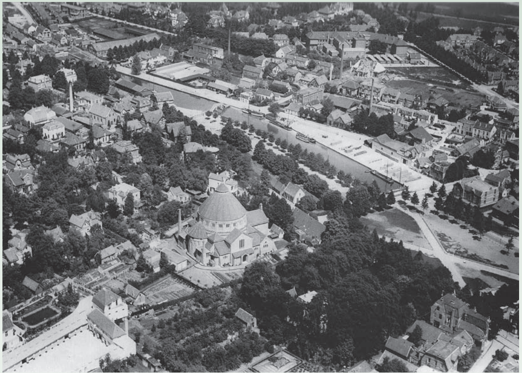
De Blekershoek gezien vanuit de lucht

Zoals gezegd waren het vooral gegoede Amsterdamse burgers die hun was naar Bussum stuurden. Dat ging vaak om 15 tot 25 waszakken tegelijk, want de gezinnen waren groot en de was werd nog niet wekelijks gedaan.