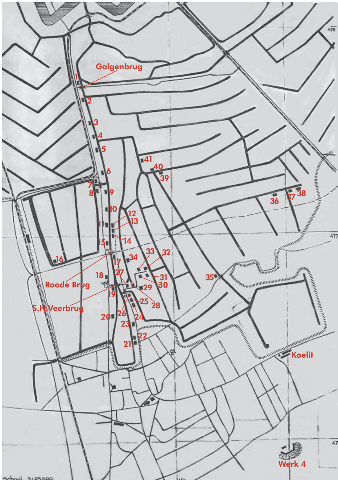
De blekerijen aan de Bussumervaart en de zanderijsloten tussen Naarden en Bussum, omstreeks 1900.