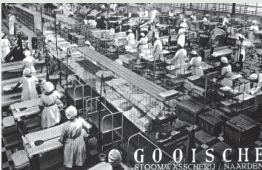
De Gooische Stoomwasscherij, net over de grens met Naarden, omstreeks 1930

In 1900 waren er zelfs 42 blekerijen in Bussum, maar de gouden jaren waren toch voorbij. Aanvankelijk profiteerde de bedrijfstak nog van de komst van nieuwe welgestelde burgers naar de villawijk het Spiegel, maar die namen op den duur hun eigen wasmeisjes in dienst. Veel kleine blekerijen, die de overgang naar de stoommachine niet hadden kunnen maken, legden het