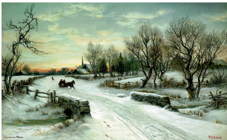
W.C. Bauer – Christmas Morning