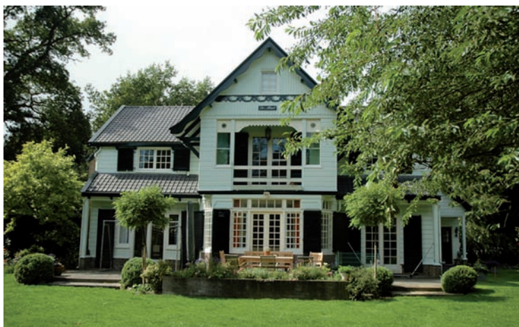
Villa De Merelhof in Aerdenhout

zou de architectuurfantasie – een noodzakelijke correctie op de functionalistische architectuur, die zich aanpaste aan de belangen van de opdrachtgever – wellicht verloren zijn gegaan.