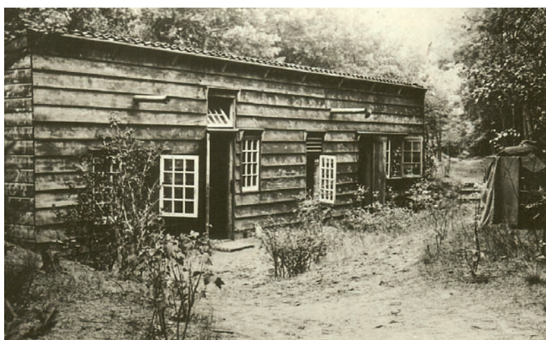
De hut van Bauer op Walden