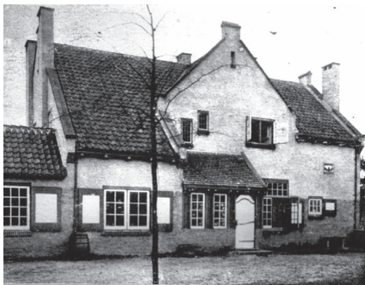
De Lelie in 1905, Nieuwe 's-Gravelandseweg 86

roos, zich ontbottende in de eerste zomerdagen, machtig als een zomerwoud en fijn als de vlinder die den rupsvorm heeft afgelegd, tintelend van leven als de jubelende zang van den vrijen vogel.' Bauer geloofde