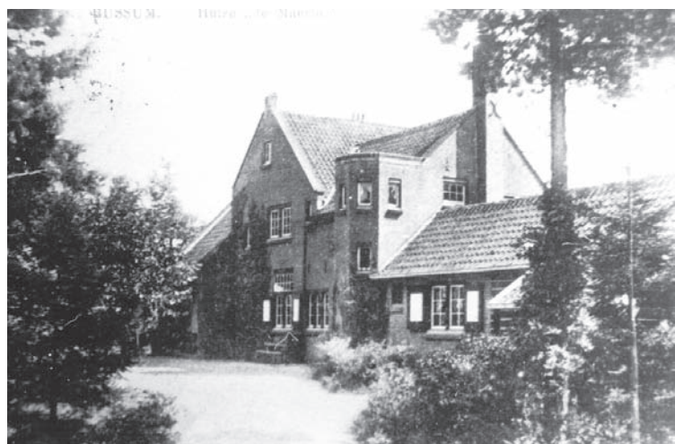
De Maerle in 1909, Nieuwe 's-Gravelandseweg 77

aandoen, maar zulk taalgebruik was in die tijd niet ongewoon.