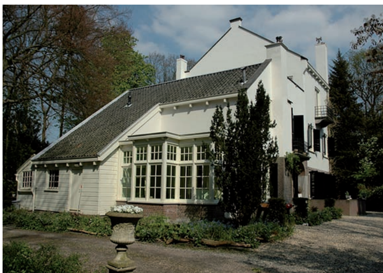
Villa voor George Breitner in Aerdenhout

De betekenis van de Architectura-groep voor de ontwikkeling van de architectuur is groot geweest. De architecten Bauer, De Bazel, Kromhout, Lauweriks en Walenkamp waren de ware opvolgers van Cuypers. Zonder hen