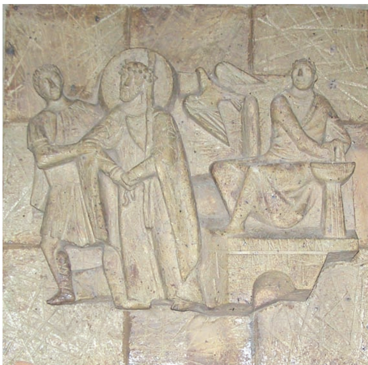
De eerste statie van de kruisweg van Mari Andriessen