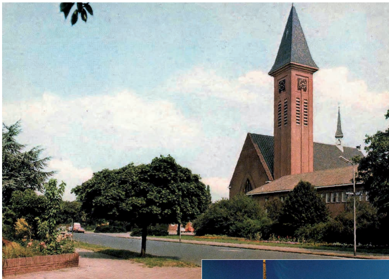
De kerk in 1980, met daarnaast basisschool De Hoeksteen

uitgebreid met vier lokalen aan de Papaverstraat en in 1959 kwam er een verdieping op de school met opnieuw vier lokalen aan diezelfde straat. In 1964 verrees aan het einde van de Bremstraat een gymzaal, waarvan ook anderen dan de leerlingen van de Heilig Hartschool gebruik konden maken. De naam van de school werd in 1972 veranderd in De Hoeksteen.