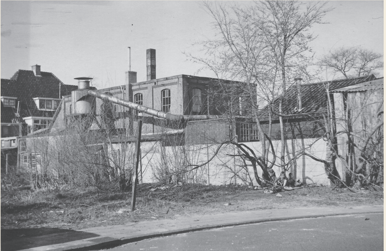
De fabriek in 1965