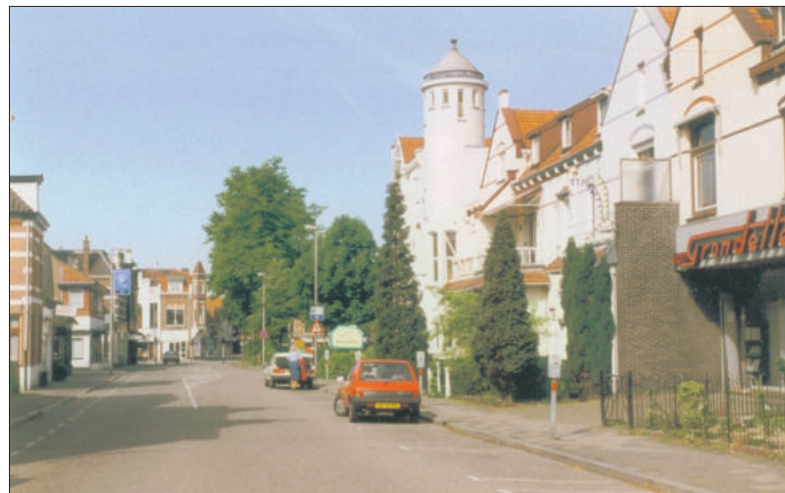
Kerkstraat nr. 3 t/m 11.

In 1890 begon Kromhout een eigen praktijk in Amsterdam. Een aansprekende opdracht kreeg hij in 1900. De nieuwe eigenaar van het in 1881 gebouwde American