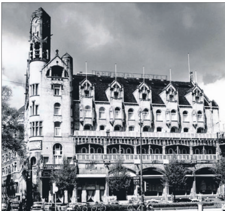
American Hotel Amsterdam.