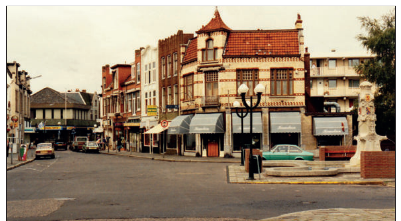
■ Wilhelminafontein in 1992.