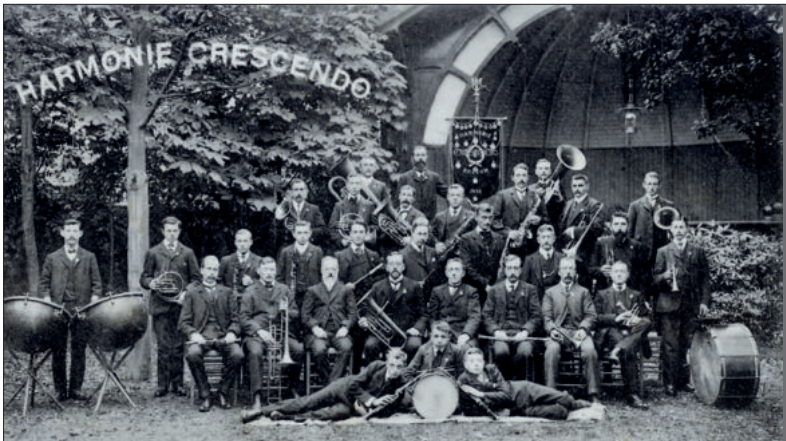
■ Harmonie ‘Crescendo’ omstreeks 1898.

Virginia Pinto Masís, “Biografie van de Wilhelminafontein” in: Bussums Historisch Tijdschrift, jaargang 32, nr. 2 (september 2016), pp. 18-20 De Telegraaf 6 september 1898 De Gooi en Eemlander 10 septem-