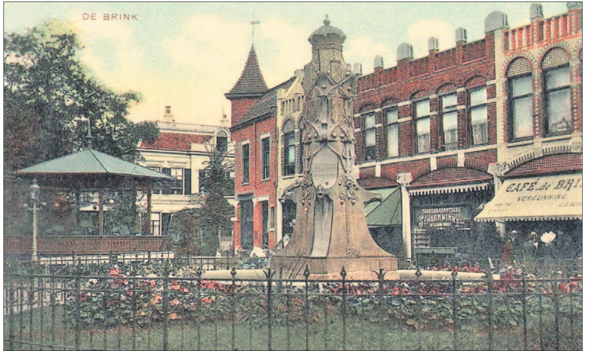
■ De Wilhelminafontein op de Brink.

Het was een gedenkteken naar de smaak van die tijd: een rijk gedecoreerde Judendstil-obelisk, opgetrokken uit Bremersteen met een driekantige voet die overgaat in zes kanten, omrankt door een levensboom. Op de zijvlakken bevinden zich tal van wapens: het wapen van Nederland, Noord-