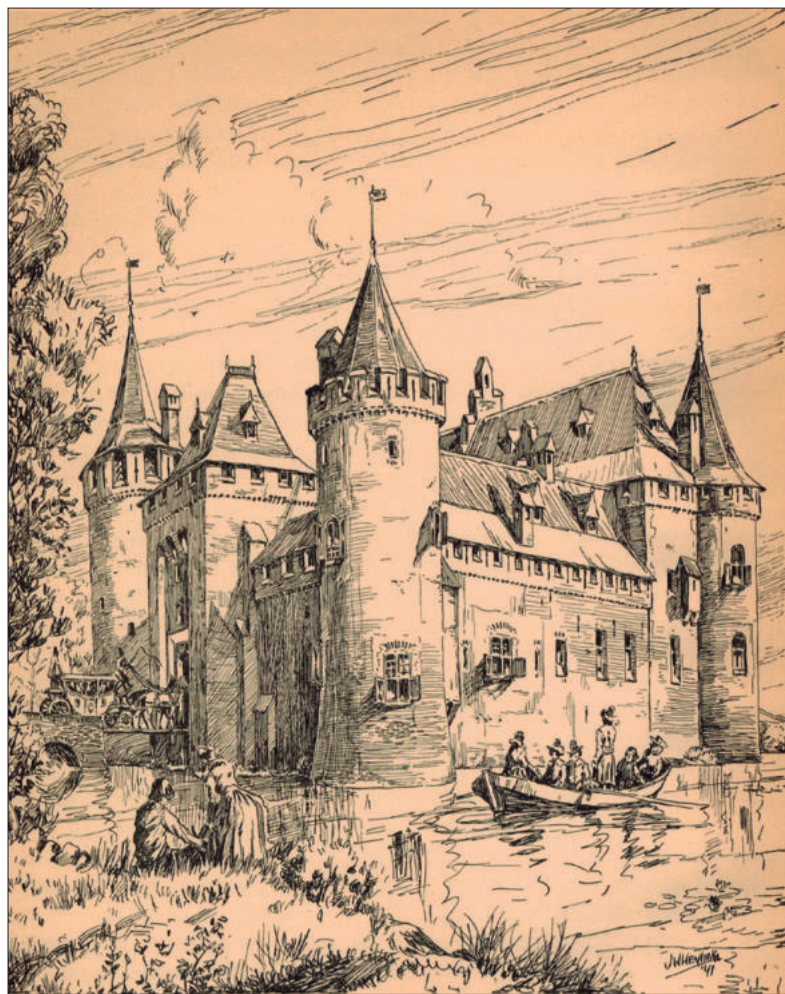
■ Tekening van Muiderslot door J.W. Heyting (1941).

uitbouwttjes, die boven aan de muur ter hoogte van de kantelen werden uitgebouwd, en die in de bodem smalle openingen had-