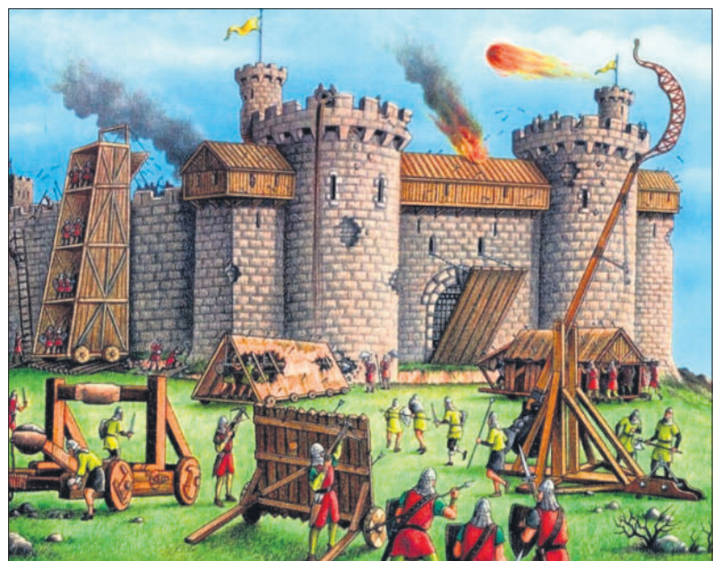
■ Middeleeuwse aanval (Tes Global Limited).

Vaak werd gekozen voor een slotgracht, die de dode hoek bestreek. Deze hielp alleen zo lang de aanvallers er niet in slaagden met bootjes vlak onder de muren te komen. Er waren daarom meer maatregelen nodig. Er werden vaak mesekouwen aangebracht. Dit waren kooivormige