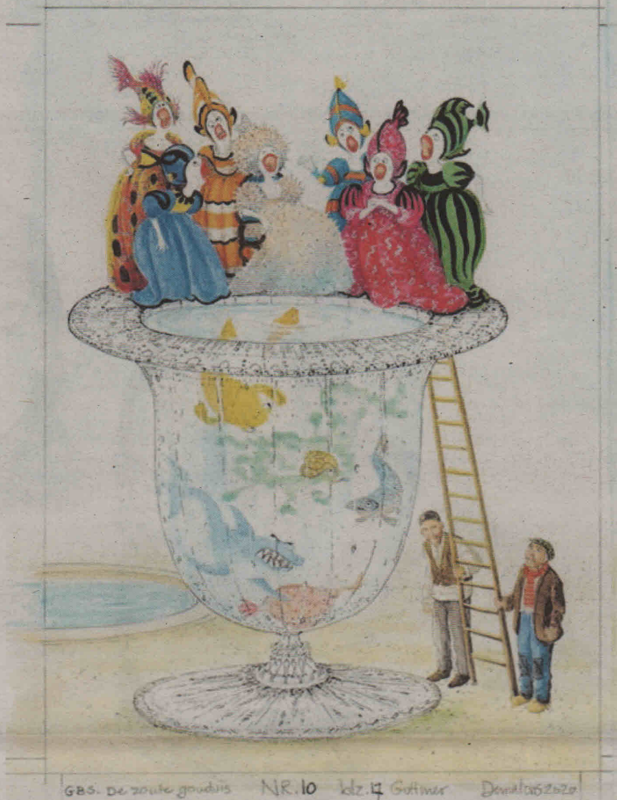
GBS. De zoute goudvis NR. 10 blz. 17 Gottmer Dematons 2020

Biegel was een meester in suggestief schrijven en het listig gebruik maken van onze 'willing suspension of disbelief'. Ook in het nieuwe sprookjesboek bevind je je regelmatig laverend op de mistige grens tussen fantasie en werkelijkheid, echt en onecht, geloof en ongeloof. 'Echte toverdingen gebeuren alleen maar als niemand het ziet', staat er in 'Het wolkenschip'. 'Daarom gelooft niemand dat ze bestaan.' Ondertussen vermoed je dan allang dat de kabouterijtjes die het meisje Madelief op het voorbij zeilende wolkenschip heeft gezien, echt zijn. Eerst denk je nog, samen met Madelief, 'wat een vreemd avontuur'. Maar wanneer het kind dat in