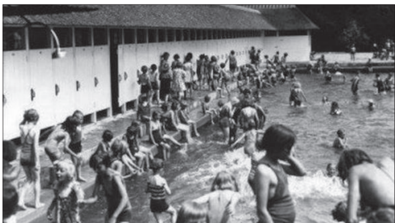
Het jeugdzwembad van Bussum, geopend in 1937.

BURGEMEESTER en WETHOUDERS van Bussum maken bekend, dat de Gemeentelijke Zweminrichting zal geopend worden op Dinsdag, 28 Mei 1912. De Zweminrichting zal voor mannen toegankelijk zijn van uur 's voormiddags en van 5—8 uur 's namiddags, terwijl vrouwen van de inrichting kunnen gebruik maken van 2—4 uur 's namiddags. Voor on- en minvermogenenden, die alleen des Woensdags en Zaterdags de Zweminrichting kunnen bezoeken, bestaat gelegenheid als zoodanig een bewijs aan te vragen aan het Politie Bureau Op Donderdag 23 en Vrijdag 24 Mei a.s. telkens van 12—2 uur. Na genoemde data zullen die bewijzen, behoudens bijzondere gevallen, niet meer worden afgegeven. Bussum, den 22sten Mei 1912. Burgemeester en Wethouders voorn., H. TH. S' JACOB. De Secretaris, REDDINGIUS.