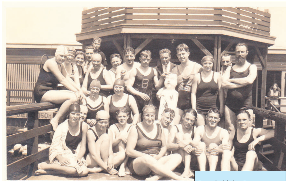
Zwimmers en zwemsters in het zwembad aan de Meerweg.

Wij willen hiermede niet insinueren, dat er in de badgelegenheden direct afkeuringswaardige feiten voorvallen, maar wij zijn overtuigd dat het langdurig verblijf in badcostuum buiten het water een verderfelijken invloed moet hebben op