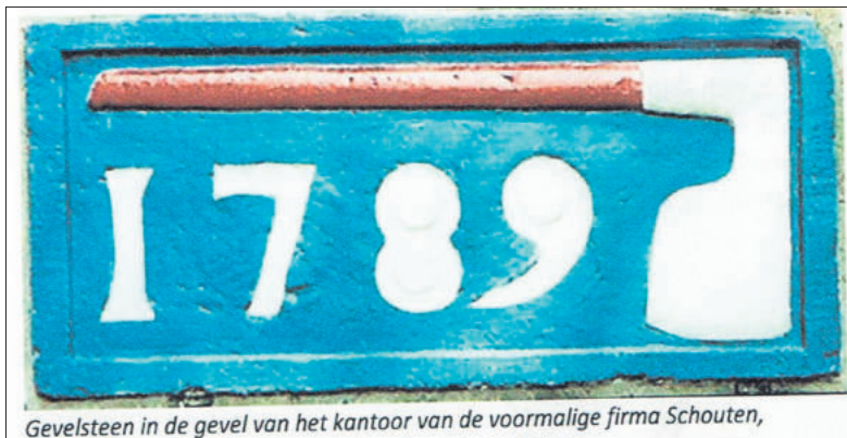
Gevelsteen in de gevel van het kantoor van de voormalige firma Schouten,

FOTO EN TEKST: GEMEENTEARCHIEF GOOISE MEREN EN HUIZEN