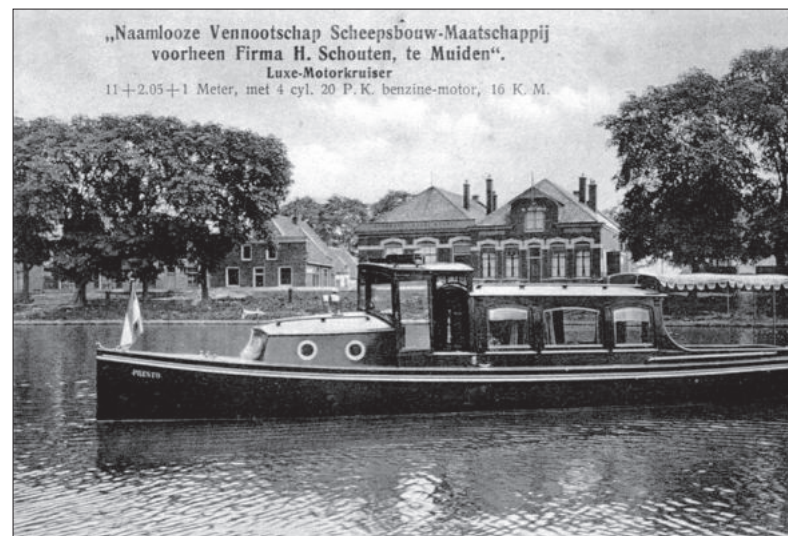
■ Schouten met boot.

stoommachines, scharen om de platen te knippen, boren en freesmachines om gaten te maken