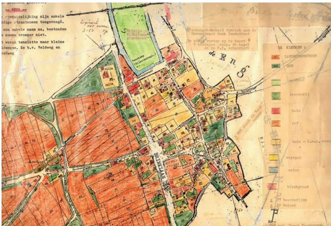
Bussum omstreeks 1924. Het dorp is nog niet veel groter, maar de haven is duidelijk zichtbaar. Links van de Brinklaan, buiten de dorpskern, villa Delta (gebouwd in 1812)

Aan de Naardense kant is de voormalige Kerkweg herdoopt in Thierensweg en Lambertus Hortensiuslaan, vernoemd naar twee vooraanstaande Naardense magistraten.