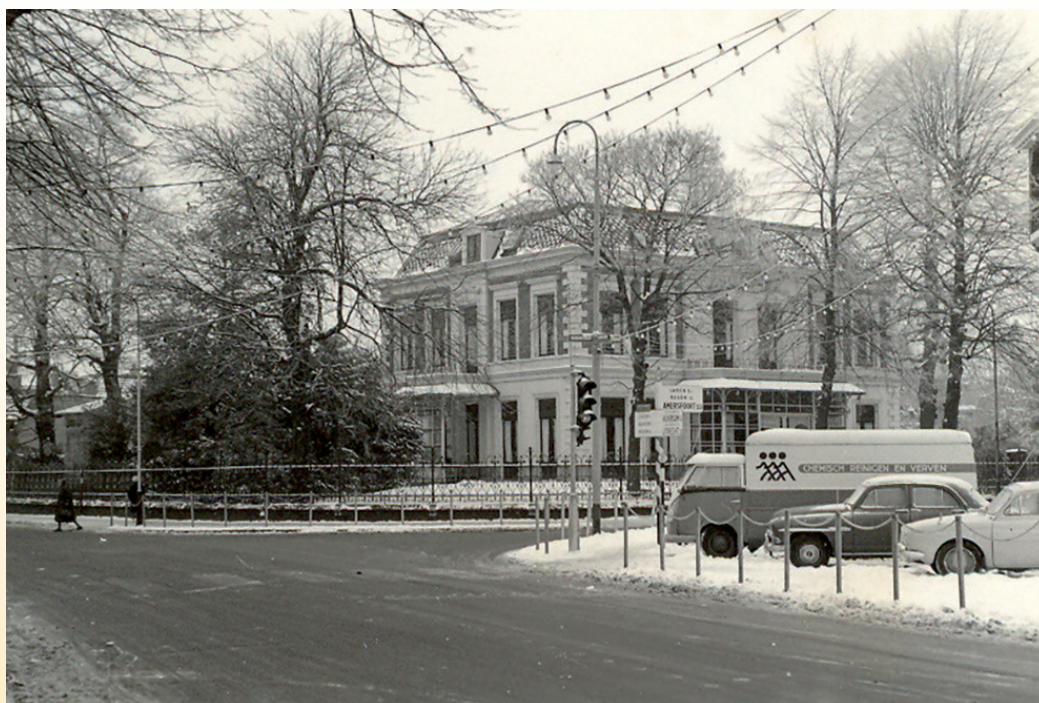
Huize Brinkhof in 1963