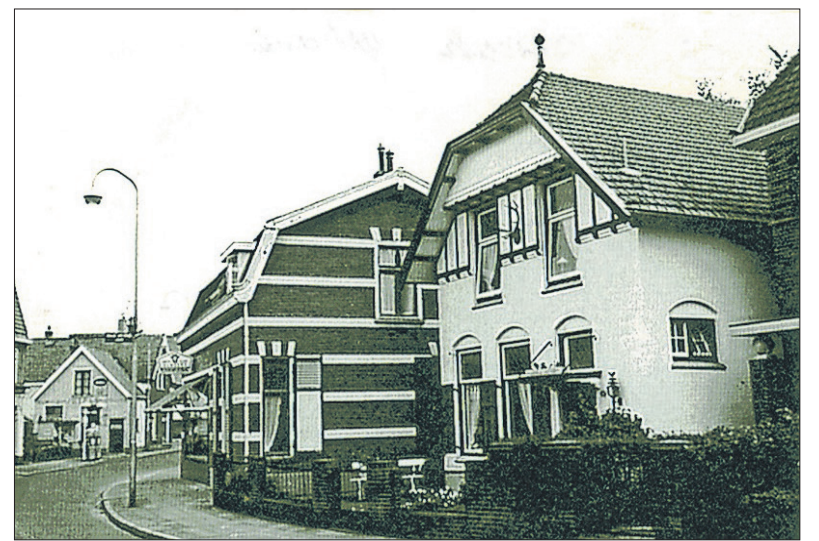
■ Herenstraat 65.

apothek overnam. Er waren toen al 13 part-time medewerkers. Bij het 100-jarig bestaan in 1987 gaf Boodt een boekje uit over de historie van de apotheek en was er een receptie in theater 't Spant. In het tijdperk Lobenstein werd ook het gebruik van de computer belangrijk in de apotheek.