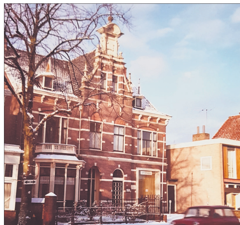
■ Brinklaan 108 en 110 vóór 1964.

FOTO EN TEKST: GEMEENTEARCHIEF GOOISE MEREN