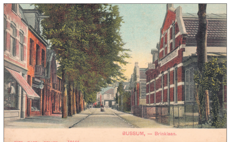
Café Delta in 1905.