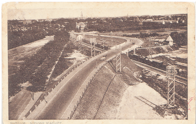
Het viaduct aan het einde van de Brinklaan, kort na de in gebruikname.