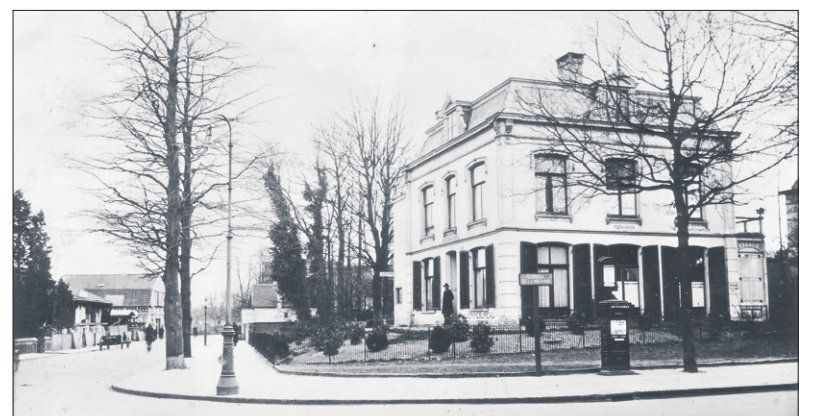
Villa Jacomina op de hoek van de Brinklaan en de Generaal de la Reyiaan.