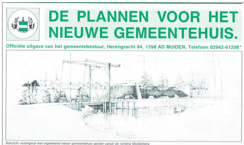
■ Tekening van het beoogde stadhuis in de vestingwal.