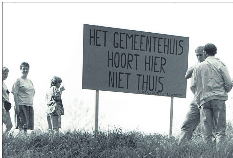
■ Demonstranten op de locatie in 1993.