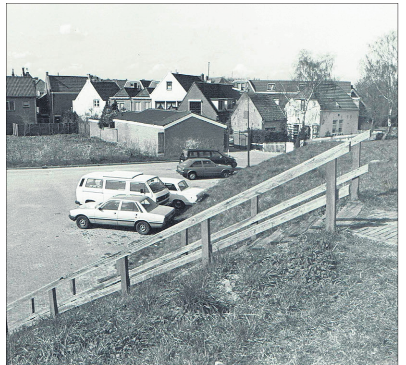
■ De beoogde locatie aan het Ravelijnsplein.

In het voorjaar van 1994 waren er verkiezingen voor een nieuwe gemeenteraad. Het nieuwe college