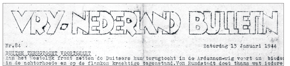
■ De kop van het Vrij-Nederland Bulletin van 13 januari 1944.