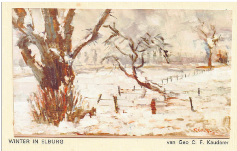
■ 'Winter in Elburg' van Geo Kauderer.

Villa Amuda maart 2000. Archief HKSM. Correspondentie P.Tack.