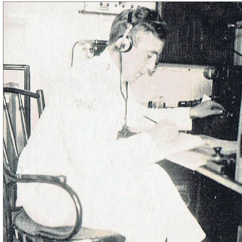
■ Kauderer als marconist.