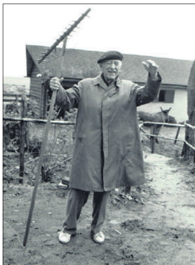
■ In Elburg met zijn ezels.