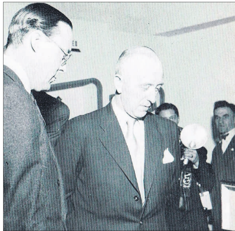
■ Kauderer met Prins Bernhard in 1953.

In 1958 kocht het bedrijf de oude Openbare School aan de Herengracht 33 toen die te koop kwam. Verschillende bedrijfsonderdelen werden daarin ondergebracht en in 1962 kwam er een groot magazijn achter de school. Het bedrijf