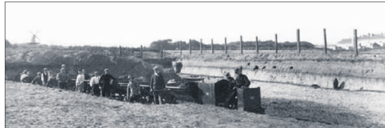
Afzanding op de Eng (nu de Groene Long) met treintje in 1931.

In 1674 geboden de Staten dat al het hoge land tot op driehonderd roeden (ruim een kilometer) rond Naarden afgegraven moest worden. Het zand werd via de Naarder- en de Muidertrekvaart naar Amster-