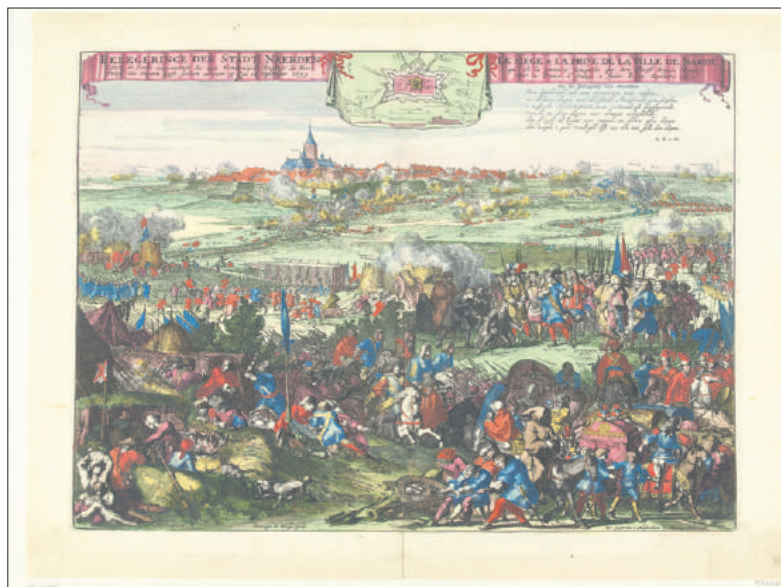
Romeyn de Hooghe, De belegering van Naarden in 1673.