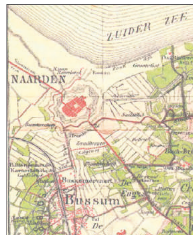
Het web van afzandingsloten in 1890.