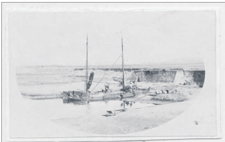
Afzanding nabij de Marconiweg omstreeks 1890.