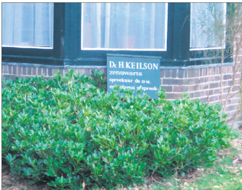
Dit bordje stond nog jaren na zijn dood in de tuin.