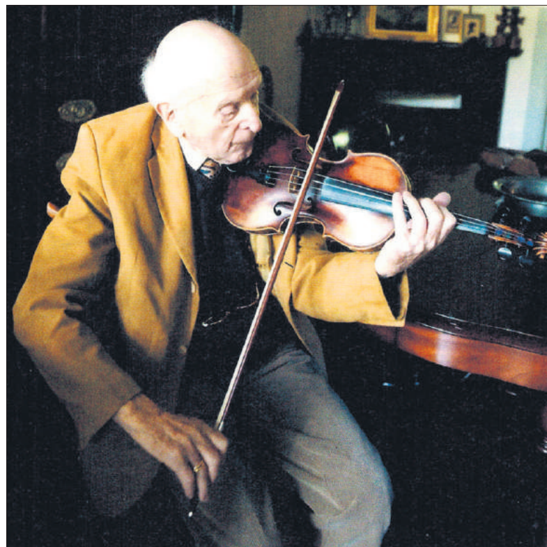
Foto van Hans Keilson in Die Welt toen hij de WELT-Literatuurpreis 2008 won.

De biografie geeft een compleet beeld van Hans Keilson: de hoffelijke, geestige en intelligente maar ook beschadigde echtgenoot en minnaar, psychiater en psycho-analyticus, sportliefhebber, musicus, schrijver en dichter. Keilson kwam met zijn verloofde in 1936 naar Nederland. Ze woonden eerst in Amsterdam, maar vertrokken al snel naar Naarden. In 1941 kregen ze een dochter, maar konden toen niet trouwen; dat gebeurde pas in 1945. Keilson zat ondergedoken in Gelderland en Delft en schreef gedichten en proza.