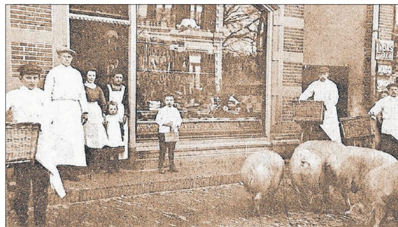
■ Slagerij Griffioen aan de Kerkstraat 6.