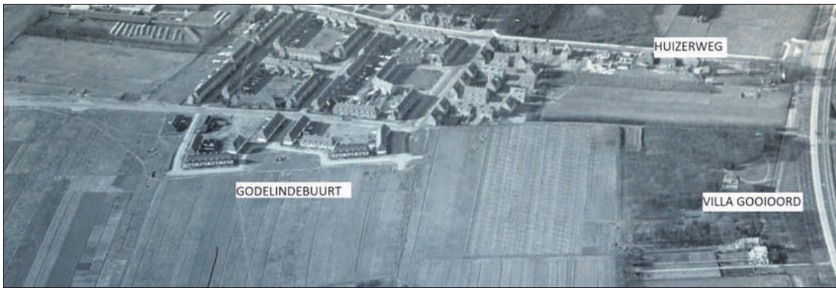
■ Luchtfoto uit 1925 van het gebied.