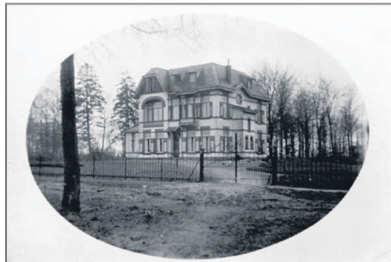
■ Villa Gooioord.

à zes varkens), kreeg hij de smaak van het investeren te pakken. Vanaf 1916 kocht hij (met geleend geld) grond en nieuwbouwhuizen, die hij met winst verkocht. Niet lang daarna verkocht hij zijn slagerij aan zijn knecht J.A. Verkleij. Ook in de varkensmesterij was hij niet langer geïnteresseerd: de varkens werden geleidelijk aan verkocht en de schuur aan de Laarderweg werd uiteindelijk verhuurd. Tussen 1916 en 1921 kocht en verkocht Griffioen zo'n dertig objecten.