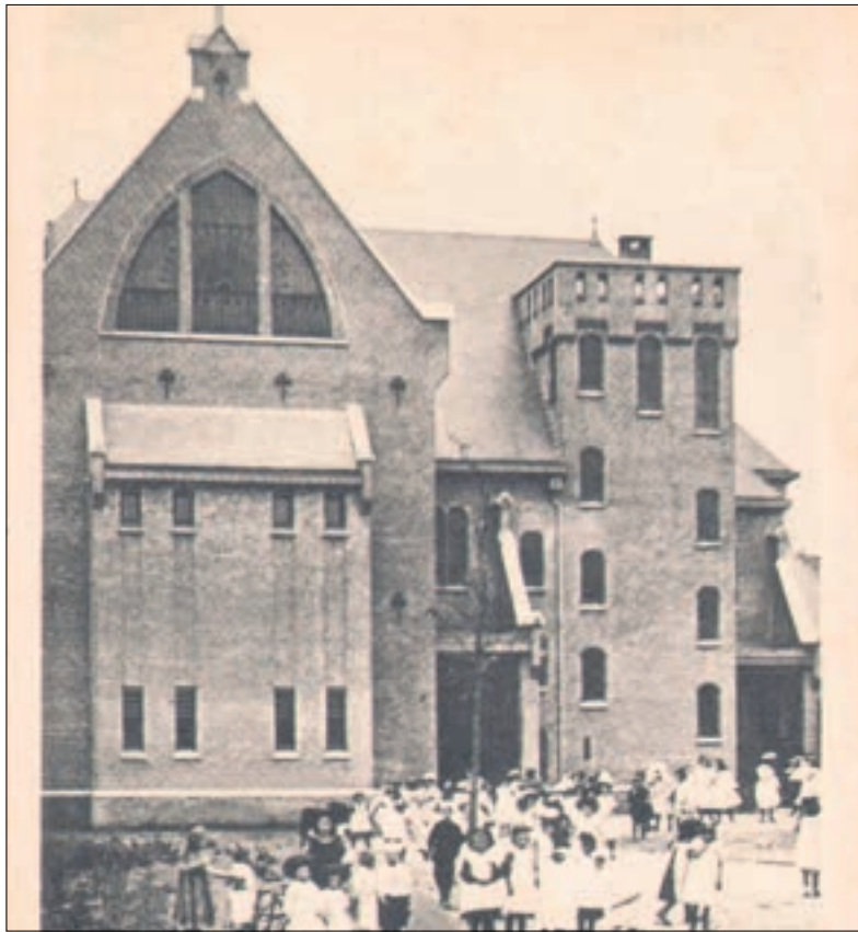
■ De Mariaschool vlak na de bouw in 1904 met rechts het trappenhuis.

In 1909 kwam er een apart gebouw bij met een gymnastieklokaal. In 1912 voegde men een ULO-afdeling toe. In 1920 werd de school gesplitst in de Mariaschool voor meisje uit gegoede gezinnen en de Henricusschool voor de overige meisjes (Hen-