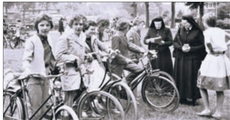
Zusters in habijt en leerlingen omstreeks 1960.

ricus was de voornaam van de aartsbisschop). Het jaar daarop moesten er twee lokalen aan de achterkant