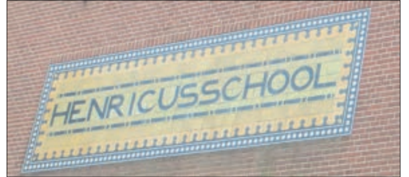
Tegeltableau van de B-school.

Vanaf het begin stond naast de normale schoolvakken godsdienst op het programma. Al snel werd gymnastiek toegevoegd en toen de school een eigen gymzaal had, werd daarvoor ook een vakleerkracht aangetrokken. Veel meisjes bleven na de zesde klas nog een extra zevende jaar en vaak zelfs nog een achtste jaar op school. Het vakkenpakket werd eind jaren 20 van de vorige eeuw uitgebreid met lessen in telefoneren, verkeer en eenvoudig boekhouden. Later kwam Frans op het lesrooster in klas 7. In 1939 werden naai- en kniplessen aan het rooster toegevoegd en in 1942 kwam daar nog Duits bij. In de praktijk kwam daar echter niets van terecht, zogenaamd omdat er geen boeken waren. Na de bevrijding verdween Duits weer van het lesrooster.