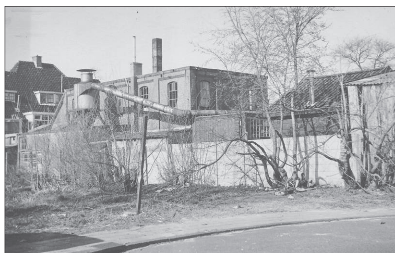
De voormalige fabriek gezien vanuit de Karbouwstraat in 1965.