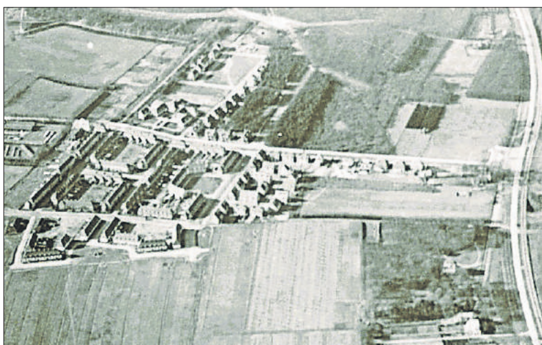
Op deze luchtfoto staat de fabriek op het lange perceel links van de nieuwgebouwde huizen.

Bron: Dit artikel werd eerder gepubliceerd in Bussums Historisch Tijdschrift 37.1 van april 2021.