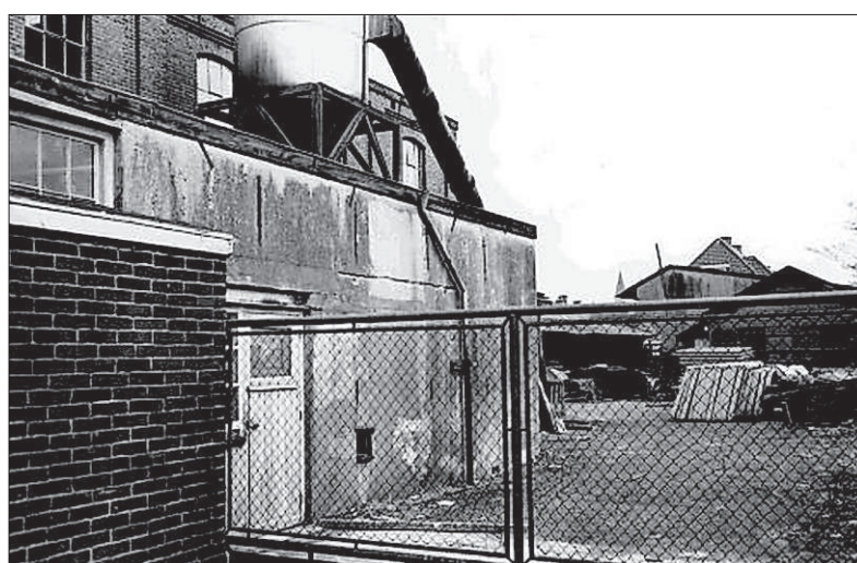
De timmerfabriek in 1935.

FOTO EN TEKST: ARCHIEF GOOI EN VECHTSTREEK