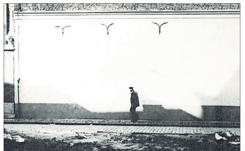
■ De man en de muur.