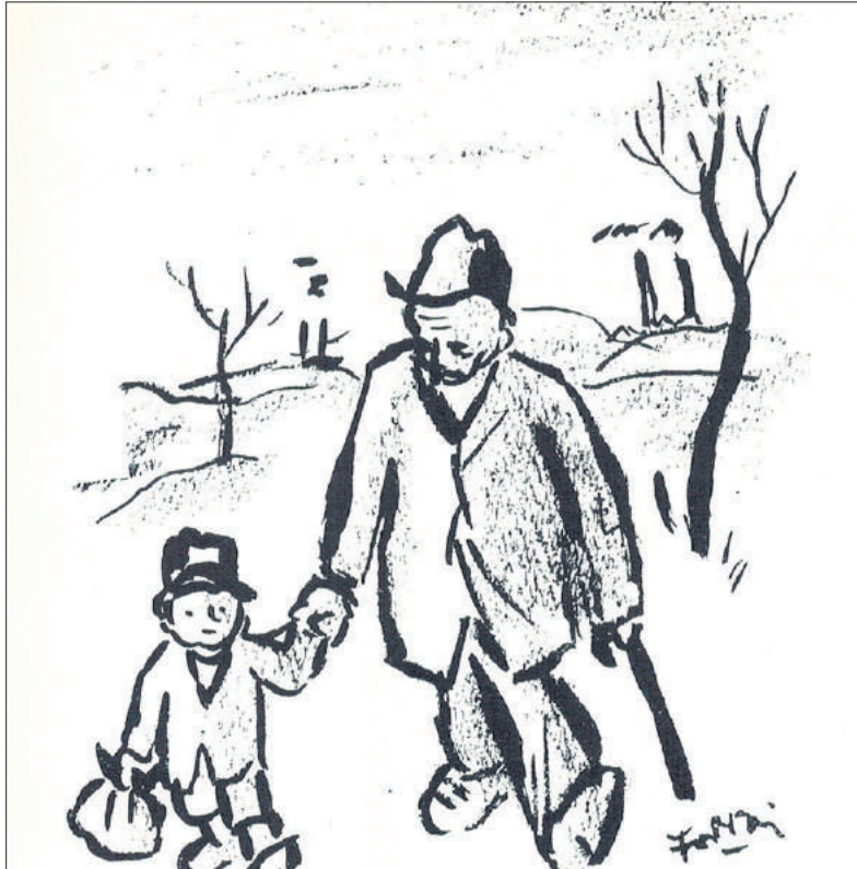
■ Enttäuschung, Simplicissimus, 8 mei 1932. Tekening Forrai.

Hongarije hadden zijn tekeningen veel succes; ze werden vaak geëxposeerd.