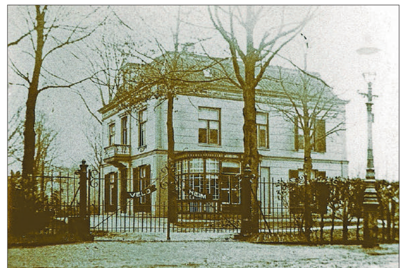
■ Villa Veldheim.

Voor het toenemend aantal leerlingen kwamen er steeds meer noodlokalen in de tuin. Toen het Vitus in januari 1966 het nieuw gebouwde schoolgebouw aan de Beerensteinerlaan betrok, kwamen de noodlokalen tot 1979 in