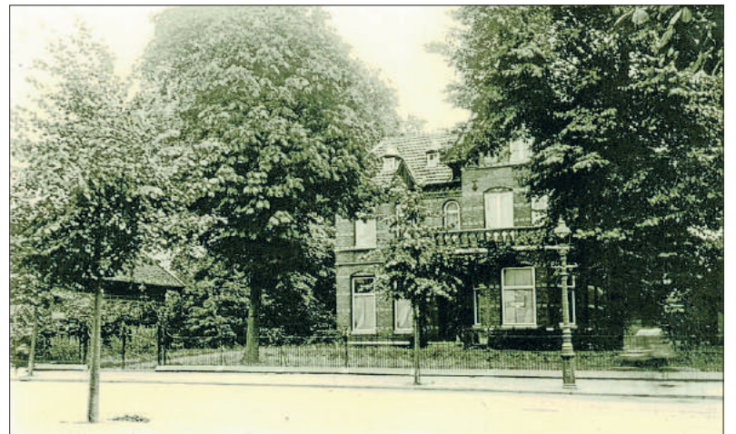
■ Villa Bellevue.

De naam Quatre Bras is aan minstens drie Bussumse villa's gegeven. De villa's Quatre Bras op Koningin Emmalaan 15 en op Graaf Wichmanlaan 27 bestaan nog (al heet de laatste niet meer zo), maar aan de Nieuwe 's-Gravelandseweg staat nu op de plek van de voormalige villa met die naam een appartementengebouw dat ook Quatre Bras heet (op de hoek