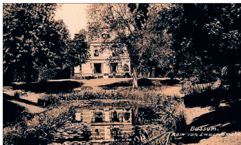
■ Villa Vijverberg.