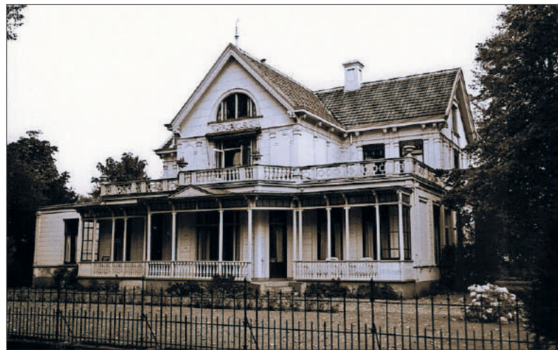
■ Villa Quatre Bras.