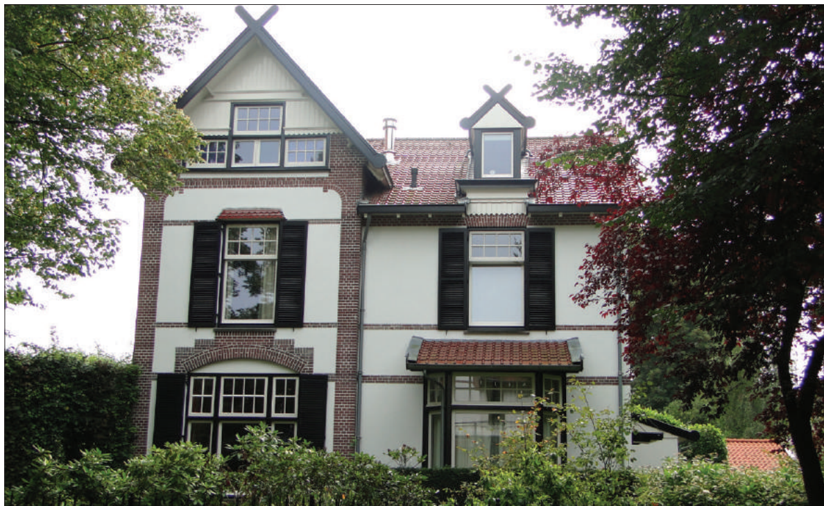
■ De villa Berbice, Prins Hendriklaan 8.

Bij aankomst op "Voorzorg" bleek dat de beloofde 50 huizen-op-palen niet waren gebouwd, er stonden slechts dertien verwaarloosde hutten. De polderdijk en de sluis waren kapot. Het beloofde vee en gereedschap waren nergens te vinden. In