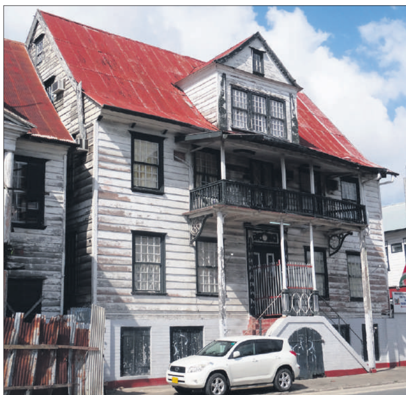
■ Het huis aan de Heerenstraat in Paramaribo bestaat nog steeds.