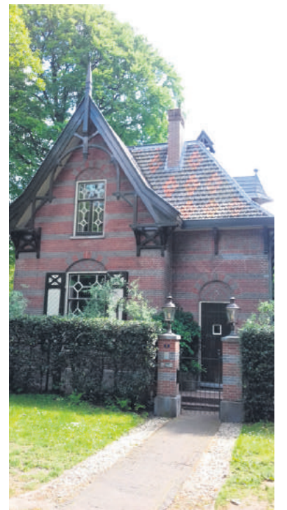
■ De tuinmanswoning.

HL4 Momenteel bestaat (een deel van) het landgoed Crailo nog als buurtschap in Huizen en als natuurgebied van het Goois Natuurreservaat. Het Pieter Langerhuizen Lambertuszoon Fonds waaruit de Koninklijke Hollandse