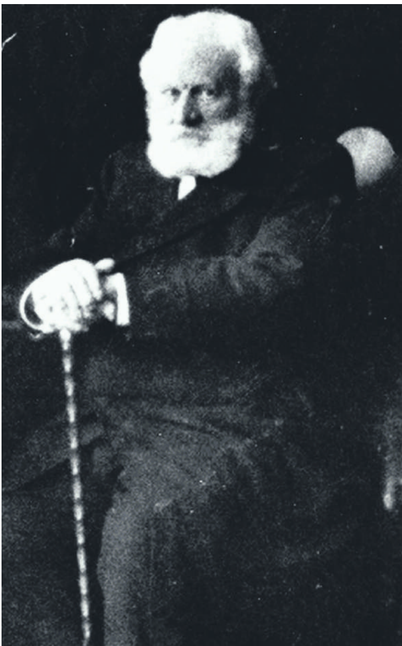
■ Pieter Langerhuizen Lambertuszoon.