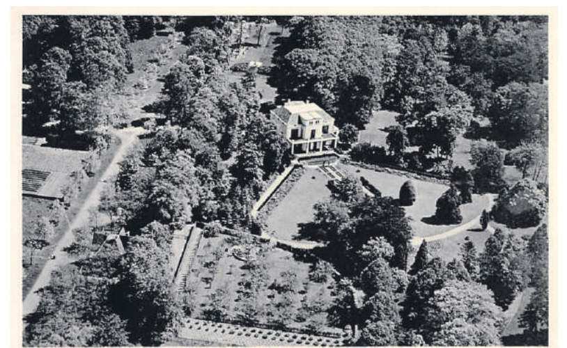
■ Villa Oud Crailo (luchtfoto KLM 1935).